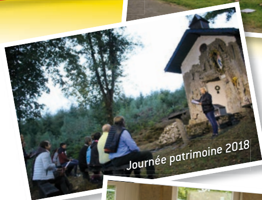
Journée patrimoine 2018