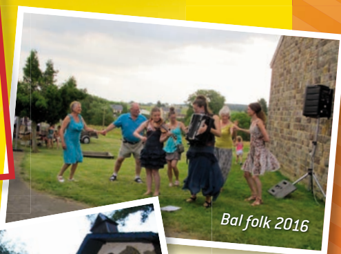
Bal folk 2016