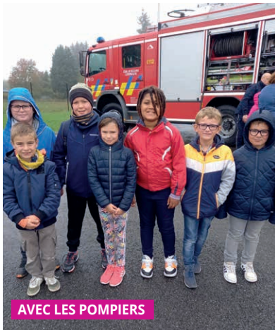
AVEC LES POMPIERS