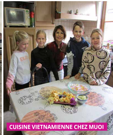
CUISINE VIETNAMIENNE CHEZ MUOI