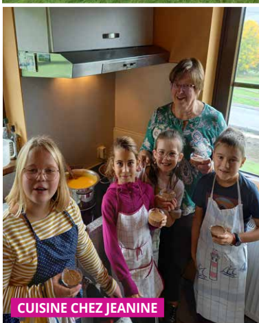
CUISINE CHEZ JEANINE