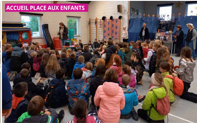
ACCUEIL PLACE AUX ENFANTS