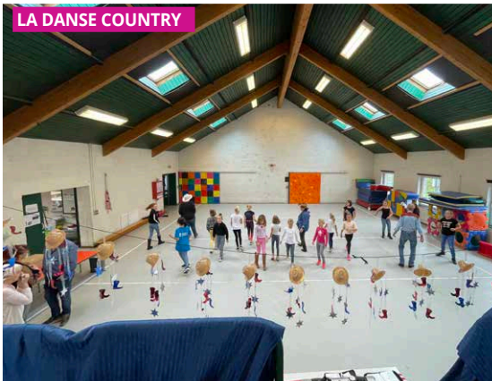
LA DANSE COUNTRY