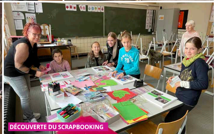
DÉCOUVERTE DU SCRAPBOOKING