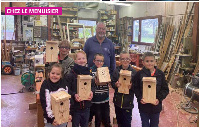
CHEZ LE MENUISIER