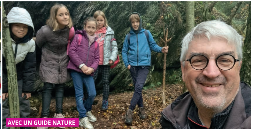
AVEC UN GUIDE NATURE