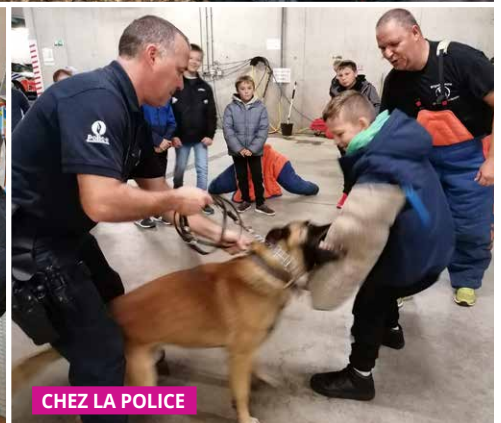
CHEZ LA POLICE