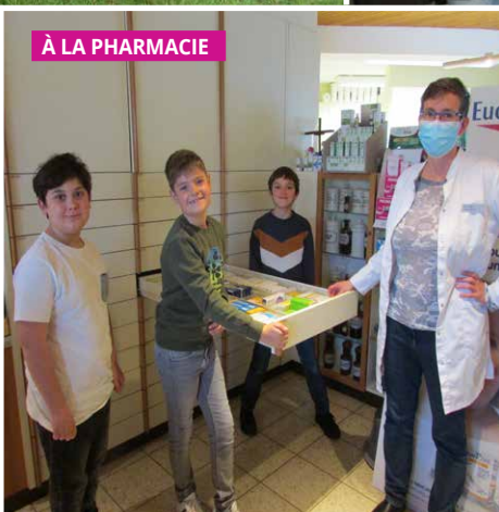
À LA PHARMACIE