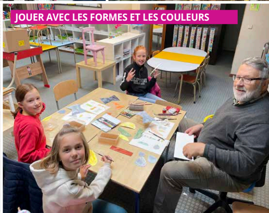
JOUER AVEC LES FORMES ET LES COULEURS