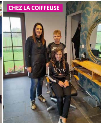
CHEZ LA COIFFEUSE