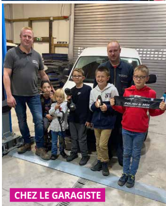
CHEZ LE GARAGISTE