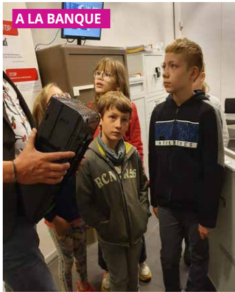
A LA BANQUE

de toucher, de s'exprimer. C'était très agréable de partager l'enthousiasme des acteurs lors de leur retour. Merci à tous ceux qui ont assuré le transport, aux photographes ainsi qu'à toutes les familles qui accueillaient nos écoliers!